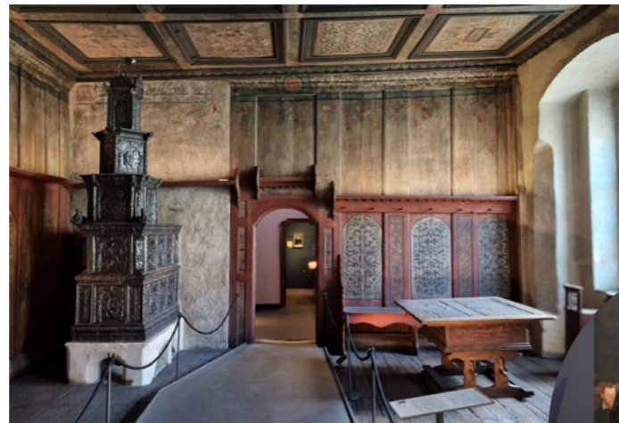
Die historische Lutherstube