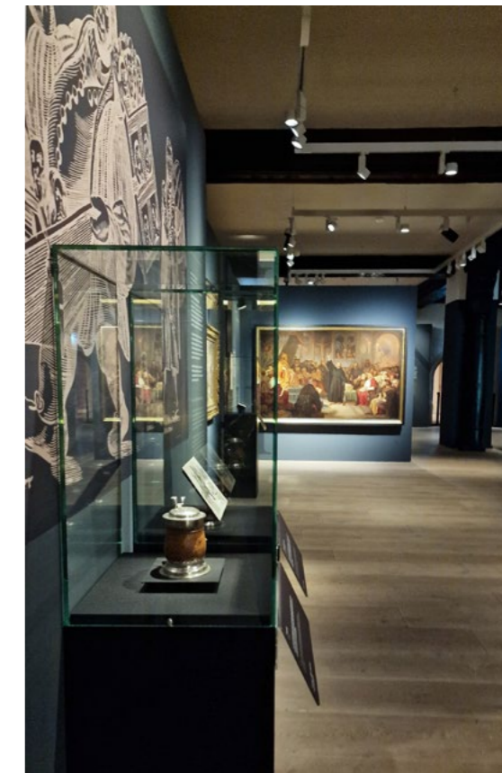
Wandabwicklung Auftakt, A wie A scese - die Kutte Martin Luthers 3D-Rendering der Planung (oben) und Foto der finalen Umsetzung (unten)