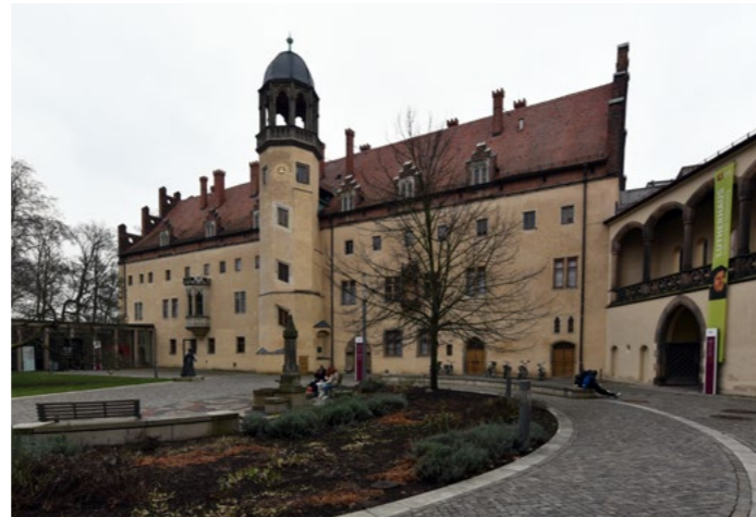
Außenansicht des Luther-Museums