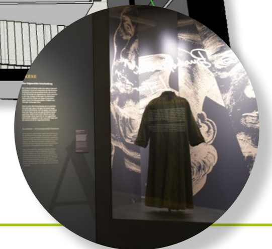
Der Beginn: A wie Askese Die Mönchskutte Martin Luthers