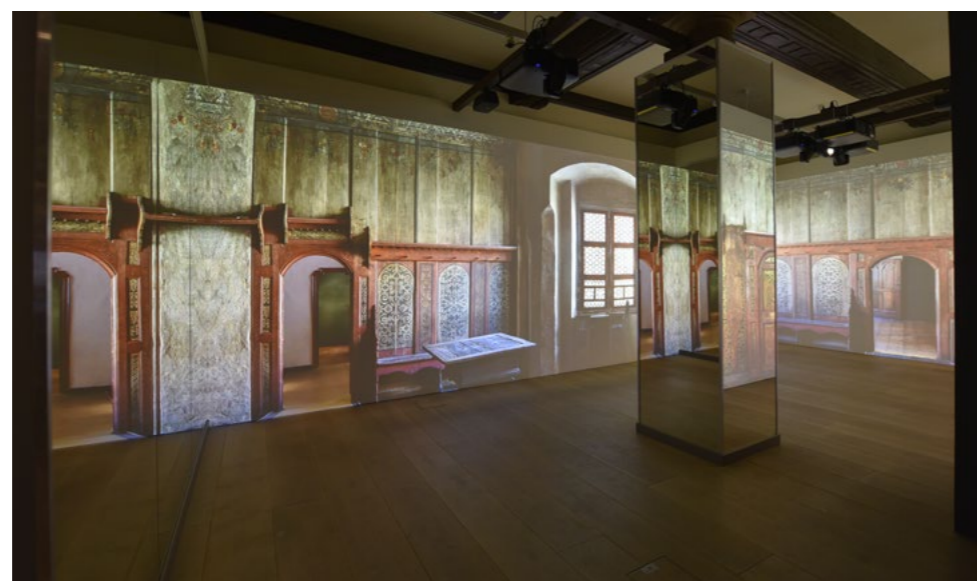
Immersive Raumprojektion „Lutherstube“ über drei Wände