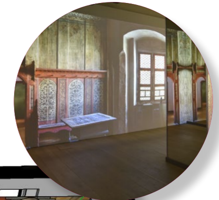
Immersive Darstellung der Lutherstube