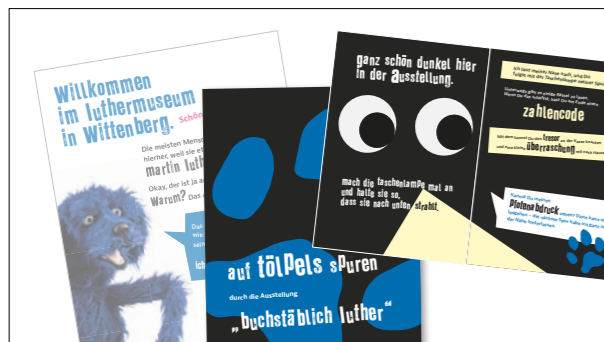
Kinderbroschüre mit Mitmachaufgaben