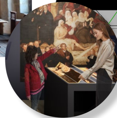
Hands-On „Who is Who?“

Medienstation Sprachlandschaft zu Zeiten Luthers