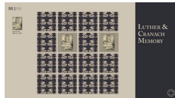
Medienstation „Cranach Memory“